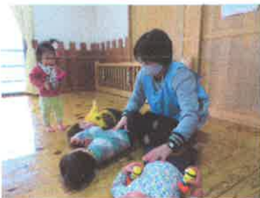
↑くすぐりたい！誰が早く降参するか、プロの腕の見せ所です。