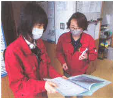
↑日頃、支援に関わっている状況から今後について考えます。

障がい者事業所(施設)において、利用者様に適切なサービスができるように管理しています。