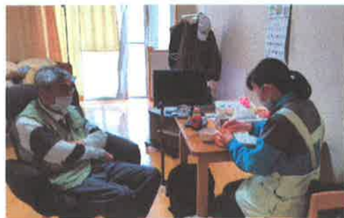
← 見守りながらサービスを提供します。