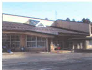
紫波町総合福祉センター