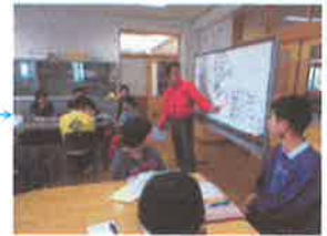
利用者主体の話し合い（自治会活動）