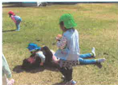
↑子どもと一緒に楽しんでいます。