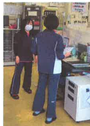
←訪問介護員からの報告を受けます。