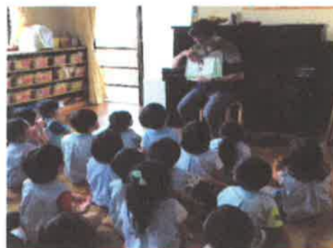
イングリッシュタイム

雨の日でも晴れた日でも、毎日、子どもたちの笑い声とそれと一緒に職員の笑い声も聞こえる園内です。