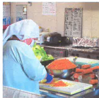
↑調理作業の様子 (虹の保育園)

調理師は、調理師資格を取得している職員です。調理員 は資格を取得していない職員です。