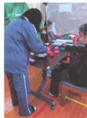
←工作活動のお手伝い

利用者様の送迎介助、血圧測定、工作活動のお手伝い、口腔機能や転倒防止のための軽体操の指導を行っています。