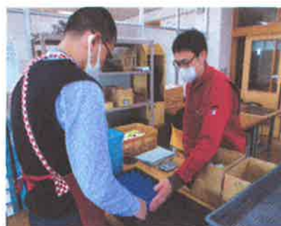
↑一緒に作業をしながら見守ります。

利用者様の作業の指導のほか安全、安心に作業 が行えるように支援します。また、作業を行う上で 必要な技術の習得、利用者様の送迎やケース記 録なども行います。