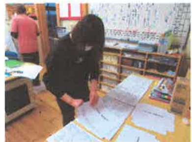
↑職員会議の準備中