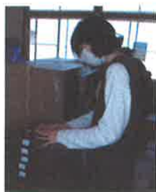
作業の最終確認も仕事のひとつです。