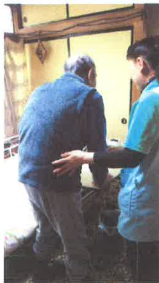
← 出来ることへお手伝い