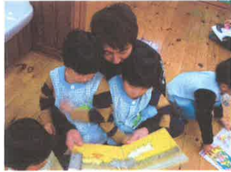
↑延長保育は担当クラスの子ども以外とも触れ合えるチャンス！

お子さんをお預かりし保育を行います。子どもたちとの活動が主ですが、おやつ準備や給食準備、活動記録や保護者への連絡ノートの記入を行います。