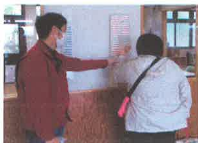
↑朝のお手伝い (タイムカード出勤確認！)